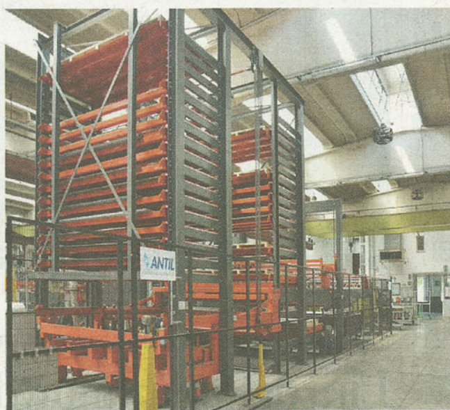
LASER Magazzino a torri multiple del sistema laser Bystronic