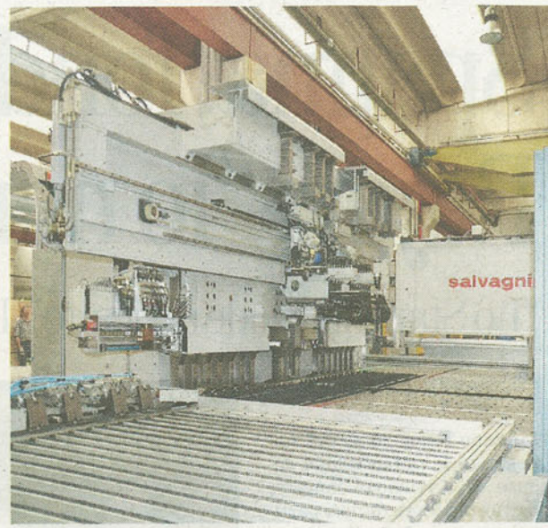
AUTOMAZIONE Piegatura lamiere metalliche Salvagnini

Il brand di ASCENSORI leader in Italia è presente in oltre 50 paesi nel mondo