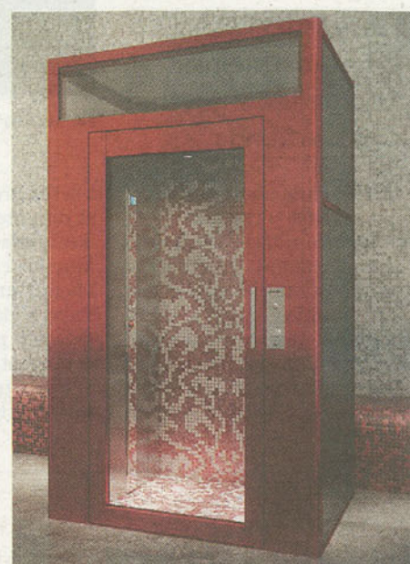
MOSAICO Fantasie di prezioso mosaico per il modello DomusLift® by BISAZZA