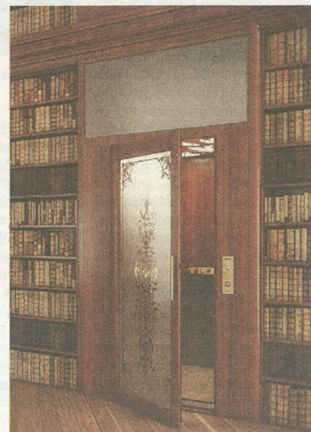
CLASSICO Effetto legno e motivi floreali liberty per la versione DomusLift® CLASSIC