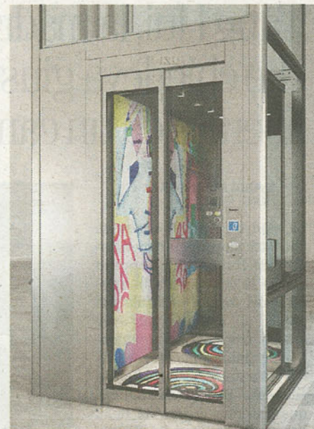
ARTE Pannelli artistici e pavimenti intarsiati in pietra per la linea DomusLift® ART LINE