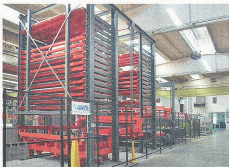
LASER Magazzino a torri multiple del sistema laser Bystronic