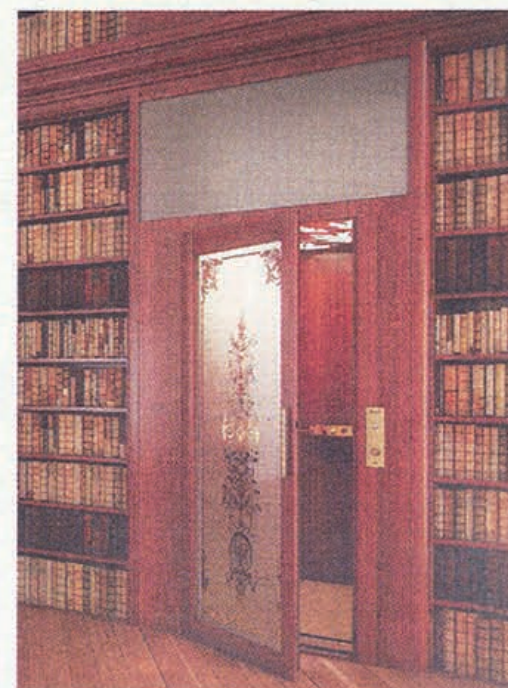
CLASSICO Effetto legno e motivi floreali liberty per la versione DomusLift® CLASSICO