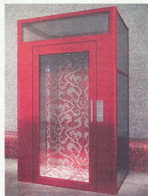
MOSAICO Fantasie di prezioso mosaico per il modello DomusLift® by BISAZZA