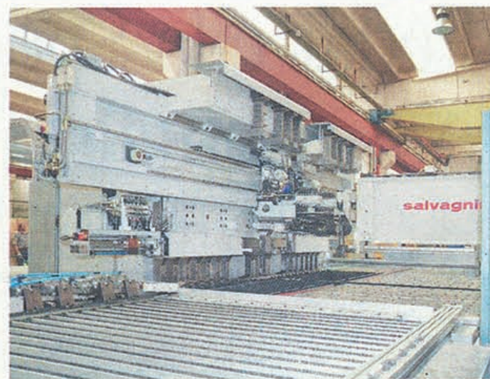
AUTOMAZIONE Piegatura lamiere metalliche Salvagnini

Il brand di ASCENSORI leader in Italia è presente in oltre 50 paesi nel mondo