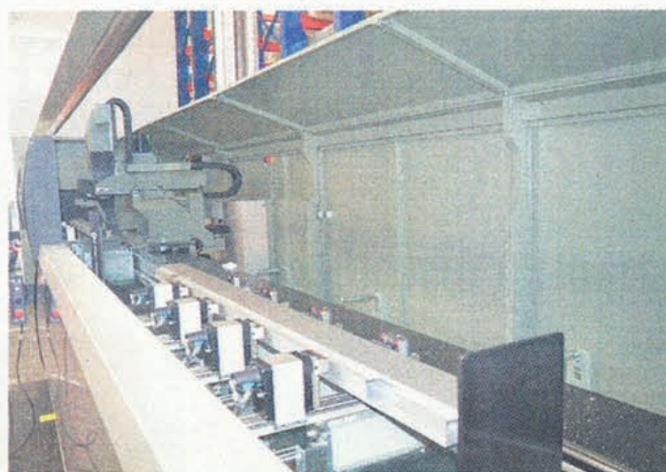
ROBOT Centro per lavorazione profilati Emmegi